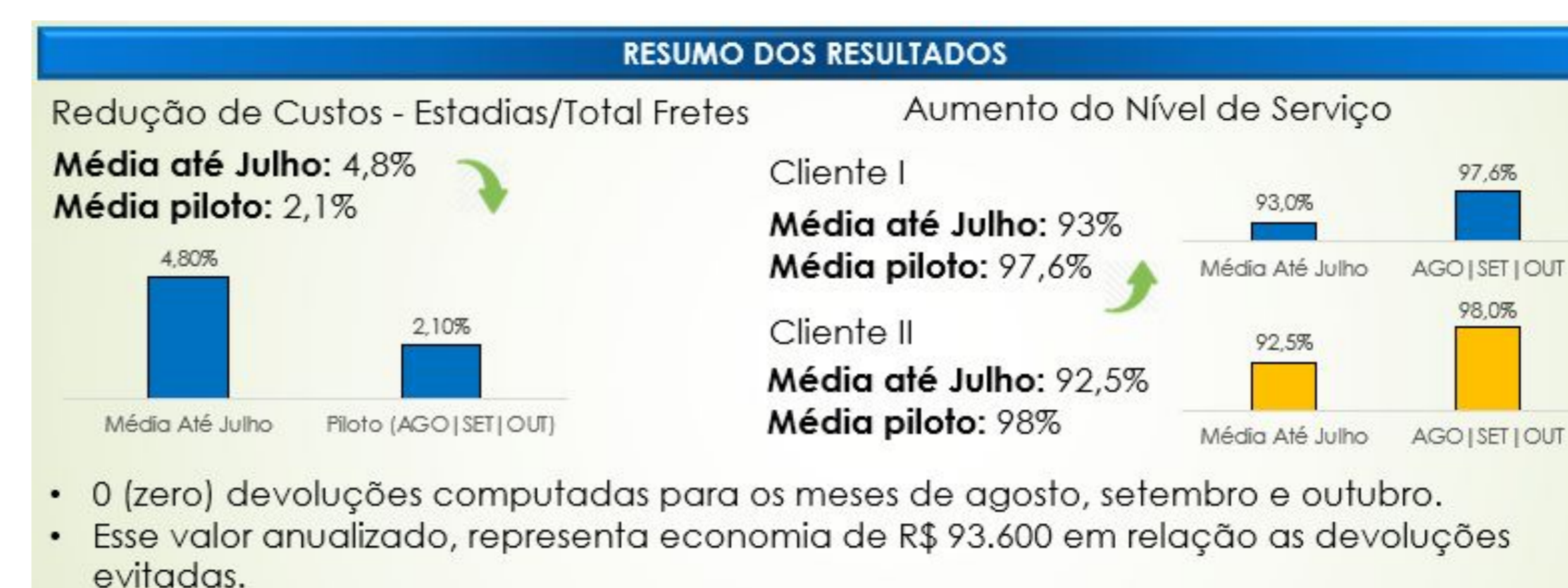
Figura 3 – Resumo dos Resultados