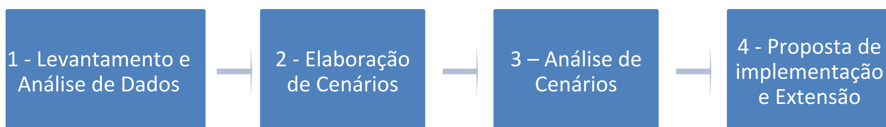
Figura 1 – Fluxograma do Método

A abordagem metodológica aplicada neste trabalho é a de pesquisa exploratória com aplicação prática, onde inicialmente há o entendimento do problema e posteriormente uma proposta.