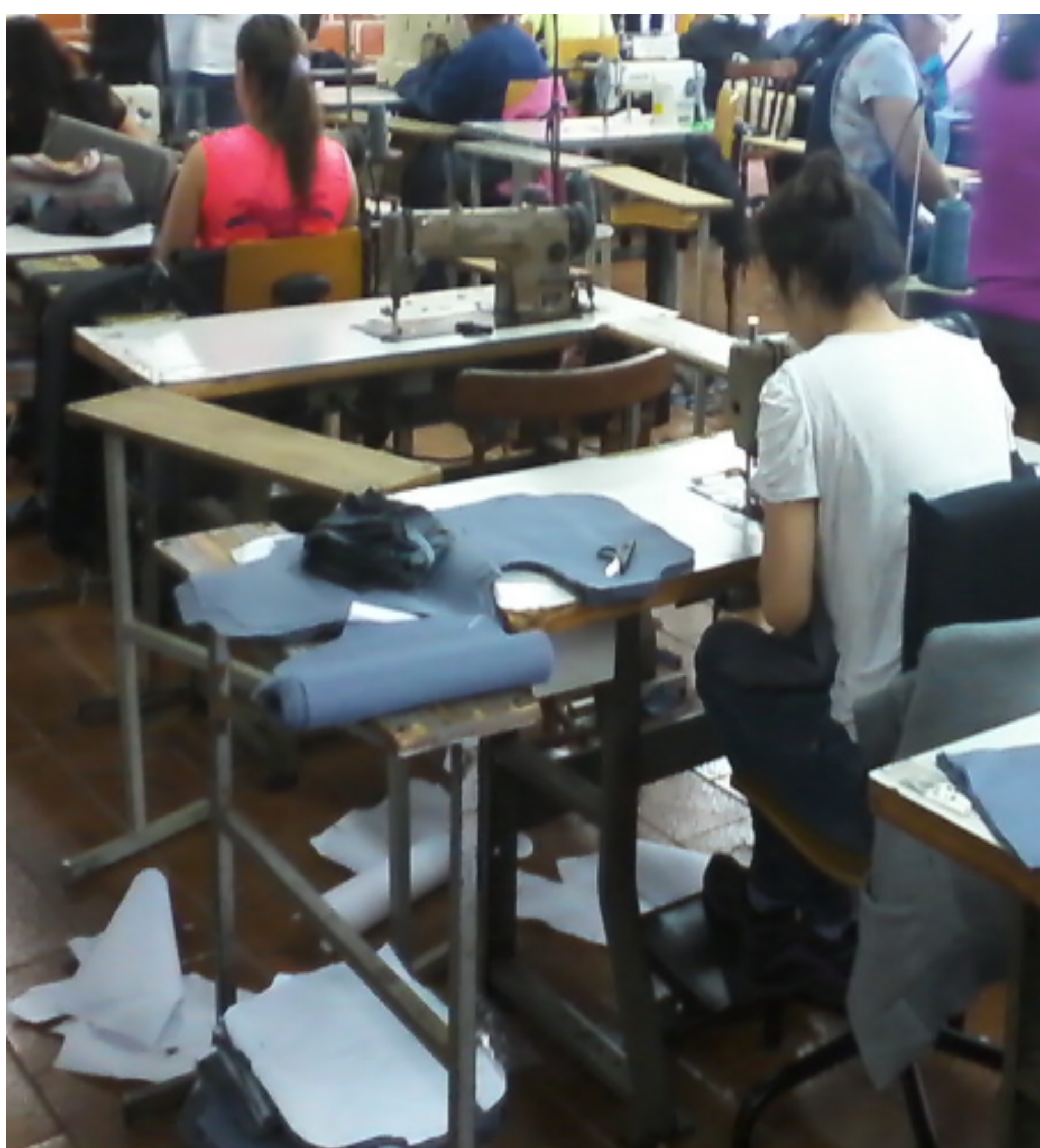
Figura 1 - evidência a falta de organização e padronização do processo

Por meio de: Observações simples; Fotografias; Entrevistas informais aos funcionários e Entrevistas estruturadas às sócias. Assim como elaboração de relatórios para registrar as informações e estruturar propostas de mitigação e melhorias